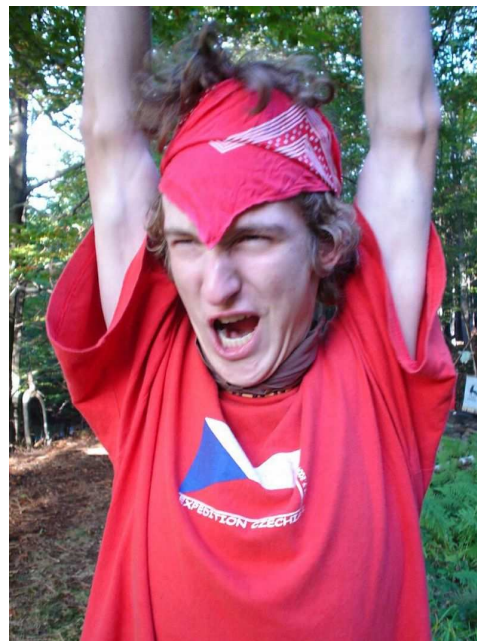
KONEČNĚ VYŠEL NOVÝPEMIKAN!

Věřím, že nás v tom nenecháte s Ájou moc dlouho plácet samotné, a objeví se tu brzo něco jak od roverů, tak od Bobříků. Pokud by se nám podařilo dát dohromady 4 čísla do roka, bude to úspěch.